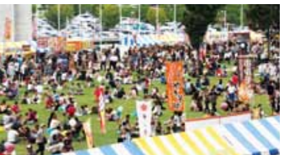
多くの人で賑わう会場

去る9月29日、とよた産業フェスタ2012を豊田スタジアムにて開催しました。今年では当所創立60周年記念として、様々なイベントも同時開催。来場者数57,000人(前年同日比142%)、売上金額15,324千円(前年同日比151%)と大盛況のうちに終了しました。9月30日は台風17号の接近に伴い、残念ながら中止の運びとなりましたが、豊田市の産業・商業に対する市民の関心を高め、地域の活性化に繋げることができました。