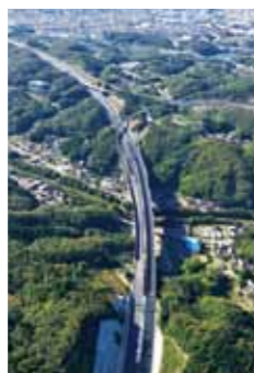
豊田東JCT西方向を俯瞰

産業集積地である豊田市の発展に必要な物流の効率化においても大きな期待が寄せられており、当所の目指す産業発展につながる幹線道路網の整備に向け大きな前進となります。