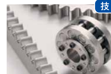
ノンバックラッシュ技術