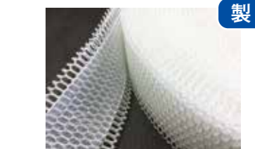
ナノファイバーフィルター及び ナノファイバー関連製品