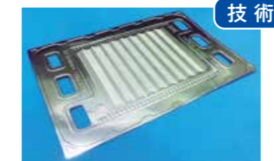
薄板金属の精密プレス技術 株式会社ニシムラ