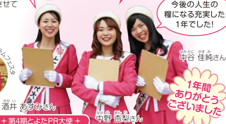
+ 第4期とよたPR大使 +