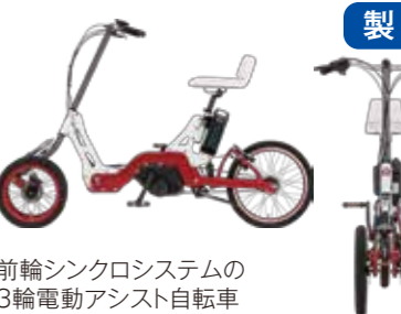
前輪シンクロシステムの 3輪電動アシスト自転車