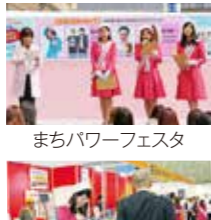
まちパワーフェスタ