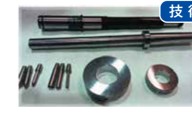
汎用機による振れ 2ミクロン以下の高精度金属研磨技術 株式会社創研